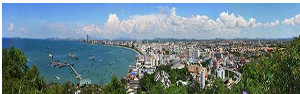
เมืองพัทยา

ภาคตะวันออก ประกอบด้วย 7 จังหวัด มีอาณาเขตติดกับภาคตะวันออกเฉียงเหนือทางทิศเหนือ ประเทศราชอาณาจักรกัมพูชาทางทิศตะวันออก ติดกับอ่าวไทยทางทิศใต้ ติดกับภาคกลางด้านตะวันตก มีเนื้อที่ 34,380 ตารางกิโลเมตร ภูมิประเทศของภาคตะวันออกแบ่งได้ 4 ลักษณะ คือ ภูมิประเทศส่วนทิวเขา มีทิวเขาสันกำแพง ทิวเขาจันทบุรี และทิวเขาบรรทัด ภูมิประเทศส่วนที่เป็นที่ราบลุ่มน้ำ คือที่ราบลุ่มน้ำบางปะกง ที่ราบชายฝั่งทะเล ตั้งแต่ปากแม่น้ำบางปะกงไปจนสุดเขตแดนที่ จังหวัดตราด ส่วนใหญ่ชายฝั่งทะเลจะมีหาดทรายสวยงาม ทั้งส่วนเกาะและหมู่เกาะ เช่น เกาะสีชัง เกาะเสม็ด หมู่เกาะช้าง และเกาะกูด