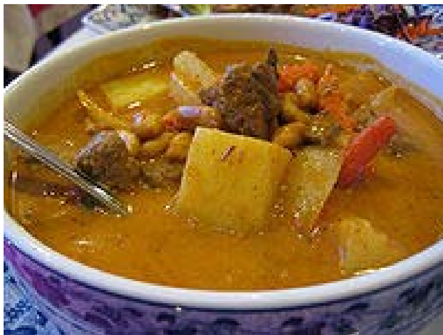
แกงมัสมั่น