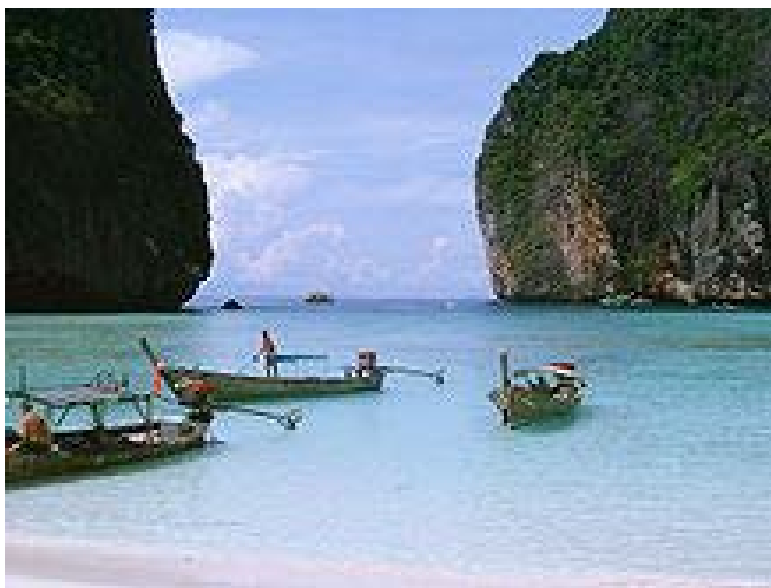
หาดมาทยา ในหมู่เกาะพีพี

ภาคใต้ เป็นส่วนหนึ่งของคาบสมุทรแคบ ๆ มีความแตกต่างกับภาคอื่น ๆ ของไทยทั้งในด้านสภาพภูมิอากาศ ภูมิประเทศ และทรัพยากร ลักษณะภูมิประเทศของภาคใต้แบ่งเป็น 4 แบบ ได้แก่