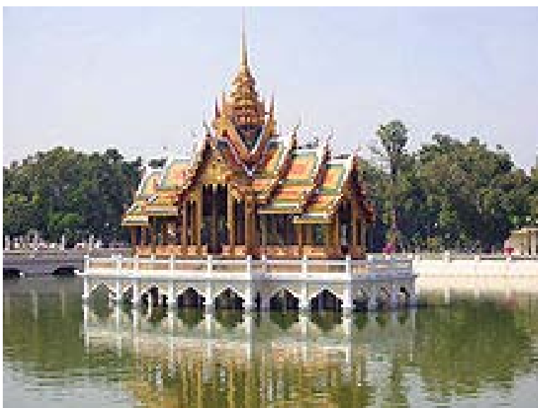
พระที่นั่งไอศวรรย์ทิพย์อาสน์ พระราชวังบางปะอิน จังหวัดพระนครศรีอยุธยา

จิตรกรรมไทย เป็นลักษณะอุดมคติ เป็นภาพ 2 มิติ โดยนำสิ่งใกล้ไว้ตอนล่างของภาพ สิ่งไกลไว้ตอนบนของภาพ ใช้สีแบบเบญจรงค์ คือ ใช้หลายสี แต่มีสีที่โดดเด่นเพียงสีเดียว