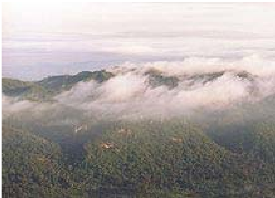
ทิวเขาเพชรบูรณ์

แอ่งสกลนคร เป็นที่ราบบริเวณฝั่งแม่น้ำโขง มีแม่น้ำสายสั้น ๆ เช่น แม่น้ำสงคราม เป็นต้น บริเวณนี้มีหนองน้ำขนาดใหญ่ เรียกว่า "หนองหาน" เกิดจากการยุบตัวจากการละลายของเกลือหิน