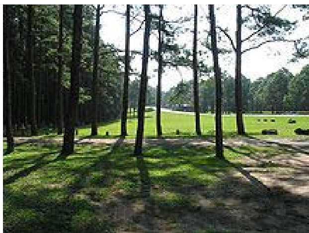
ป่าสนในจังหวัดเชียงใหม่

สภาวิจัยแห่งชาติได้แบ่งประเทศไทยออกเป็น 6 ภูมิภาค ตามลักษณะธรรมชาติ รวมไปถึงธรณีสันฐานและทางน้ำ รวมไปถึงรูปแบบวัฒนธรรมมนุษย์ โดยภูมิภาคต่าง ๆ ได้แก่ ภาคเหนือ ภาคตะวันออกเฉียงเหนือ ภาคกลาง ภาคตะวันออก ภาคตะวันตก และภาคใต้ ภูมิภาคทางภูมิศาสตร์ทั้งหกนี้มีความแตกต่างกันโดยมีเอกลักษณ์ของตนเองในด้านประชากร ทรัพยากรพื้นฐาน ลักษณะธรรมชาติ และระดับของพัฒนาการทางสังคมและเศรษฐกิจ ความหลากหลายในภูมิภาคต่าง ๆ เหล่านี้ได้เป็นส่วนสำคัญต่อลักษณะทางกายภาพของประเทศไทย