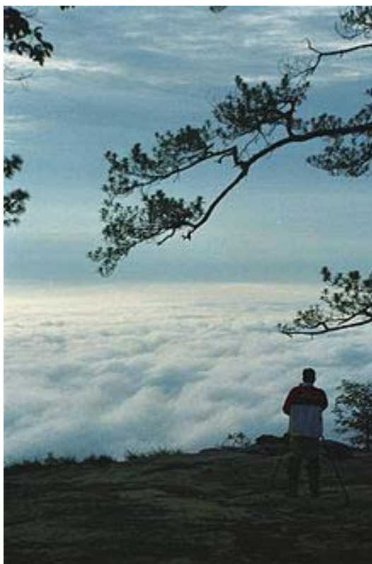
ผานกแอ่น ในอุทยานแห่งชาติภูกระดึง

แม่น้ำเจ้าพระยาและแม่น้ำโขงถือเป็นแหล่งเกษตรกรรมที่สำคัญของประเทศไทย การผลิตของอุตสาหกรรมเกษตรจะต้องอาศัยผลผลิตที่เกี่ยวเนื่องได้จากแม่น้ำทั้งสองและสาขาทั้งหลาย อ่าวไทยกินพื้นที่ประมาณ 320,000 ตารางกิโลเมตร ซึ่งไหลมาจากแม่น้ำเจ้าพระยา แม่น้ำแม่กลอง แม่น้ำบางปะกง และแม่น้ำตาปี ซึ่งเป็นแหล่งดึงดูดนักท่องเที่ยว เนื่องจากน้ำตื้นใสตามแนวชายฝั่งของภาคใต้และคอคอดกระ อ่าวไทยยังเป็นศูนย์กลางทางอุตสาหกรรมของประเทศ เนื่องจากมีท่าเรือหลักในสัดหีบ และถือได้ว่าเป็นประตูที่จะนำไปสู่ท่าเรืออื่น ๆ ในกรุงเทพมหานคร ส่วนทะเลอันดามันถือได้ว่าเป็นแหล่งทรัพยากรธรรมชาติที่มีคุณค่ามากที่สุดของไทยเนื่องจากมี รีสอร์ทที่ได้รับความนิยมอย่างสูงในทวีปเอเชีย รวมไปถึงจังหวัดภูเก็ต จังหวัดกระบี่ จังหวัดระนอง จังหวัดพังงา จังหวัดตรัง