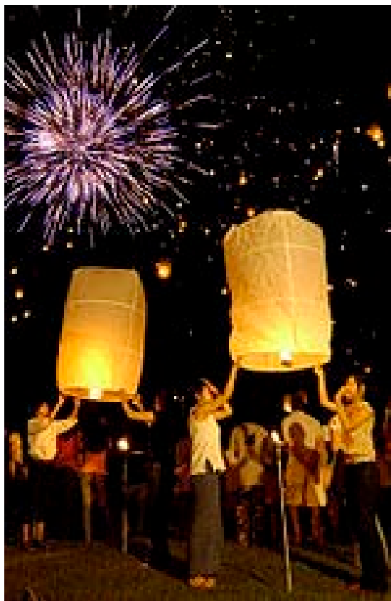
การปล่อยโคมลอยในงานประเพณียี่เป็ง

ดนตรีในประเทศไทยนั้นได้รับอิทธิพลมาจากประเทศต่างๆ ดนตรีไทยเป็นดนตรีที่มีความไพเราะน่าฟัง มี 4 ประเภท ได้แก่ ดิด สี ตี เป่า ในอดีตดนตรีไทยนิยมเล่นในการขับลำนำและร้องเล่น ต่อมามีการนำเอาเครื่องดนตรีจากต่างประเทศเข้ามาผสม ดนตรีไทยนิยมเล่นกันเป็นวง เช่น วงปี่พาทย์ วงเครื่องสาย วงมโหรี ดนตรีไทยเข้ามามีบทบาทในชีวิตประจำวันมากขึ้น โดยใช้ประกอบงานมงคล งานอวมงคล ฯลฯ ในปัจจุบันดนตรีไทยไม่ค่อยเป็นที่นิยมกันแพร่หลายนักเนื่องจากหาผู้ได้ยาก คนส่วนใหญ่จึงไม่ค่อยรู้จักดนตรีไทย